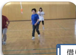
借り物競争&お菓子食い競争！